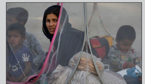
از طالبان فرض کرده‌اند.

سازمان ملل متحد از کشورهای همسایه افغانستان خواسته که مرزهای خود را به روی آوارگان افغان نبندند و گفته علاوه بر کمبود مواد غذایی و دارویی در افغانستان، بخش‌های زیربنایی این کشور چون بیمارستان‌ها و مدارس هم در معرض نابودی قرار گرفته است. بنابر گزارش سازمان ملل متحد، ظرف یک ماه گذشته شدت گرفتن پیش‌روی طالبان، بیش از ۱۰۰۰ غیرنظامی جان باختند. اردوگاه‌هایی که به دست مردم و یک شبه برپا شده‌اند در اطراف و مرکز کابل محل اسکان هزاران افغانی شده‌اند که پایتخت را آخرین سنگر امن برای فرار